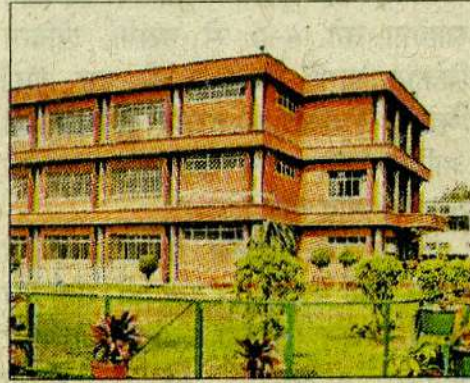
एसडी कॉलेज। फाइल

कॉलेज प्रशासन के अनुसार, इन कोर्सों को पंजाब यूनिवर्सिटी और अन्य सक्षम