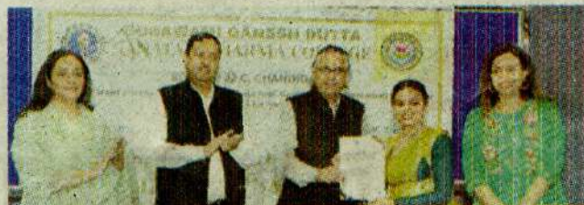
प्रतिभागी को सर्टिफिकेट देते हुए।

एसडी एमयूएन कांफ्रेंस के दौरान विभिन्न आकर्षक समितियों का गठन किया गया, जिनमें यूनाइटेड नेशंस कमोशन ऑन द स्टेटस ऑफ वूमन (यूएनसीएसडब्ल्यू), ऑर्गनाइजिंग कमेटी (ओसी), इंडियन प्रीमियर लीग (आईपीएल) सिमुलेशन कमेटी और इंटरनेशनल प्रेस (आईपी) शामिल रहे।