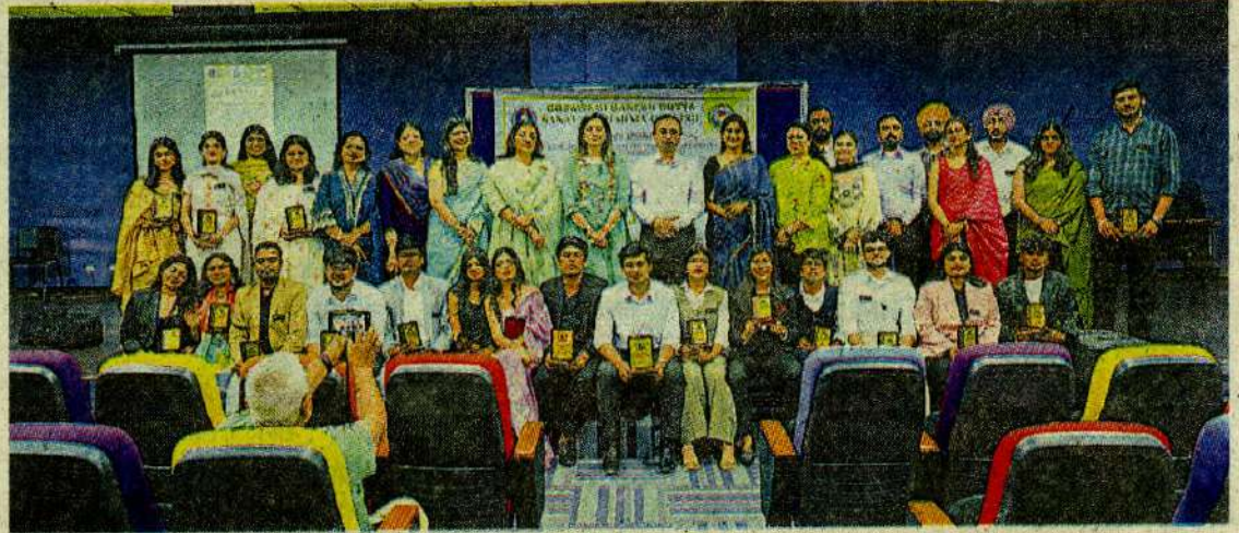
एसडी एमयूएन कांफ्रेंस में भाग लेते स्टूडेंट्स व स्टाफ कालेज