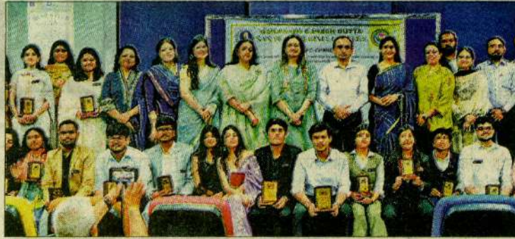
एसडी एमयूएन कॉन्फ्रेंस में शामिल विशेषज्ञ और क्लब के सदस्य। आयोजक

कॉलेज के एसडी एमयूएन क्लब की ओर से डिजिटल सेफ्टी क्लब के सहयोग से आयोजित इस फ्लैगशिप सम्मेलन ने युवाओं को कूटनीति, संवाद और नेतृत्व कौशल सीखने का व्यावहारिक अवसर दिया। विभिन्न समितियों के माध्यम से