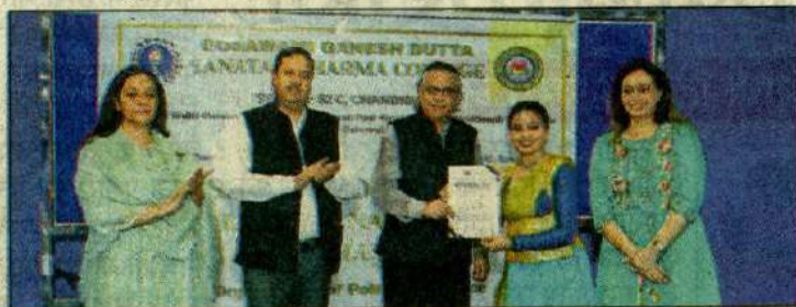
प्रिंसीपल और मुख्य अतिथि छात्राओं को सम्मानित करते हुए।