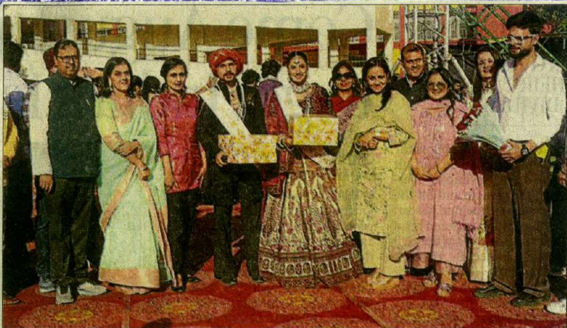
Faculty with winners at Virasat-26 at SD college in Chandigarh on Friday.