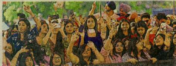
गिप्पी ग्रेवाल के गानों पर थिरकता युवा जोश कालेज