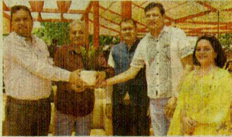
मुख्यअतिथि का वेलकम करते हुए प्रिंसिपल

जी जी डी ए स डी कॉलेज सैक्टर 32 में वीरवार को दो दिवसीय वार्षिक सांस्कृतिक महोत्सव विरासत 2026 का आगाज हुआ। इस वार्षिक