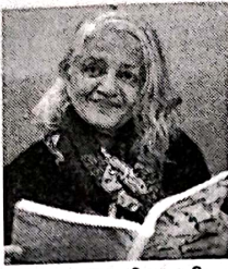
ਸੰਪਾਦਕਾ, ਪ੍ਰੀਤ ਲੜੀ

ਸ ਕੀ ਭ ਸ ਸੰਪਾਦਕੀ ਭਖਦਾ ਕਵਿਤਾ ਨਾਟਕ ਸ ਯ ਯ ਕ ਕਹਾਣੀ ਯਾਦ ਜਾਣਕਾਰੀ ਗੁਜ ਰਸ ਏ ਨ ਨ ਏ ਦਾਰ ਜੀ ਨੂੰ ਯਾਦ ਕਰਦਿਆਂ ਨਵੀਂ ਕਿਤਾਬ ਲੜੀਵਾਰ ਮੁਲਾਕਾਤ ਖ ਹੀ ਖ ਬਲਾਂ ਲੜੀ ਹੁੰਗਾਰੇ English Matter