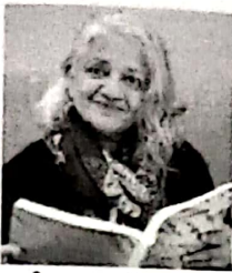
ਸੰਪਾਦਕਾ, ਪ੍ਰੀਤ ਲੜੀ

ਸ ਭ ਕ ਸ ਸੰਪਾਦਕੀ ਭਾਖਦਾ ਕਵਿਤਾ ਨਾਟਕ ਕ ਜ ਯ ਕ ਕਹਾਣੀ ਯਾਦ ਜਾਣਕਾਰੀ ਗਜ ਗਜ ਕ ਨ ਠ ਟ ਦਾਰ ਜੀ ਨੂੰ ਯਾਦ ਕਰਦਿਆਂ ਨਵੀਂ ਕਿਤਾਬ ਲੜੀਵਾਰ ਮੁਲਾਕਾਤ ਬ ਹੁੰਗਾਰੇ ਬਾਲਾ ਲਈ E English Matter