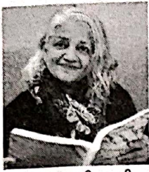
ਸੰਪਾਦਕਾ, ਪ੍ਰੀਤ ਲੜੀ

ਸ ਕ ਭ ਸ ਨ ਕੀ ਭ ਸੰਪਾਦਕੀ ਨਾਟਕ ਕਵਿਤਾ ਭਖਦਾ ਕ ਕ ਸ ਯ ਕ ਕਹਾਣੀ ਗਾਸ ਰਾਸ ਯਾਦ ਕਹਾਣੀ ਮੁ ਮੁ ਲ ਨ ਦ ਦਾਰ ਜੀ ਨੂੰ ਯਾਦ ਕਰਦਿਆਂ ਮੁਲਕਾਰ ਨਜੀਵਾਰ ਨਵੀਂ ਕਿਤਾਬ ਬ ਹੁੰਦੇ ਬ ਬਾਲਾਂ ਲਈ English Matter ਹੁੰਗਾਰੇ