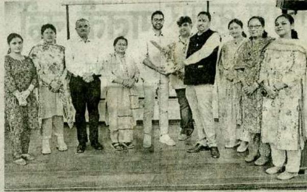
चंडीगढ़। एसडी कालेज में मुख्यातिथि को सम्मानित करते शिक्षक