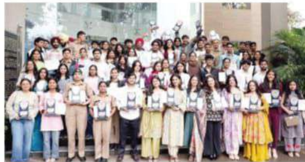
Students posing with their degrees and certificates.