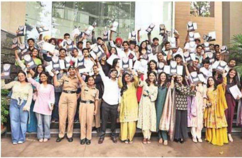
वार्षिक पुरस्कार समारोह पुरस्कार वाले स्टूडेंट्स • कालेज