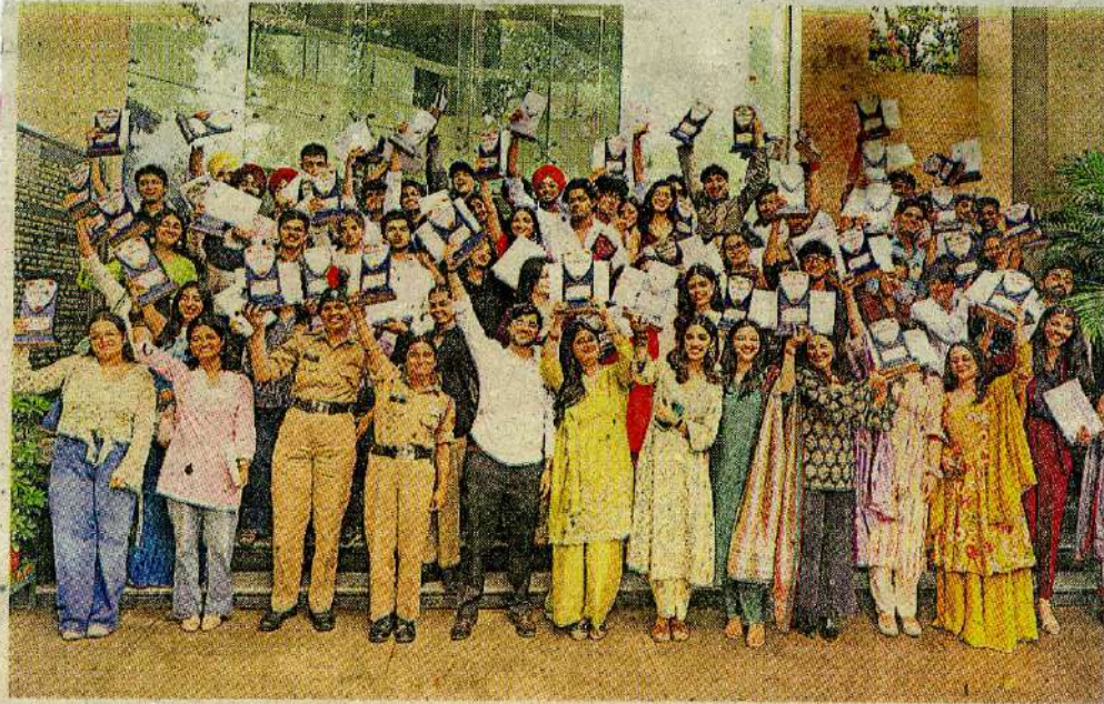
वार्षिक पुरस्कार समारोह पुरस्कार वाले स्टूडेंट्स • कालेज