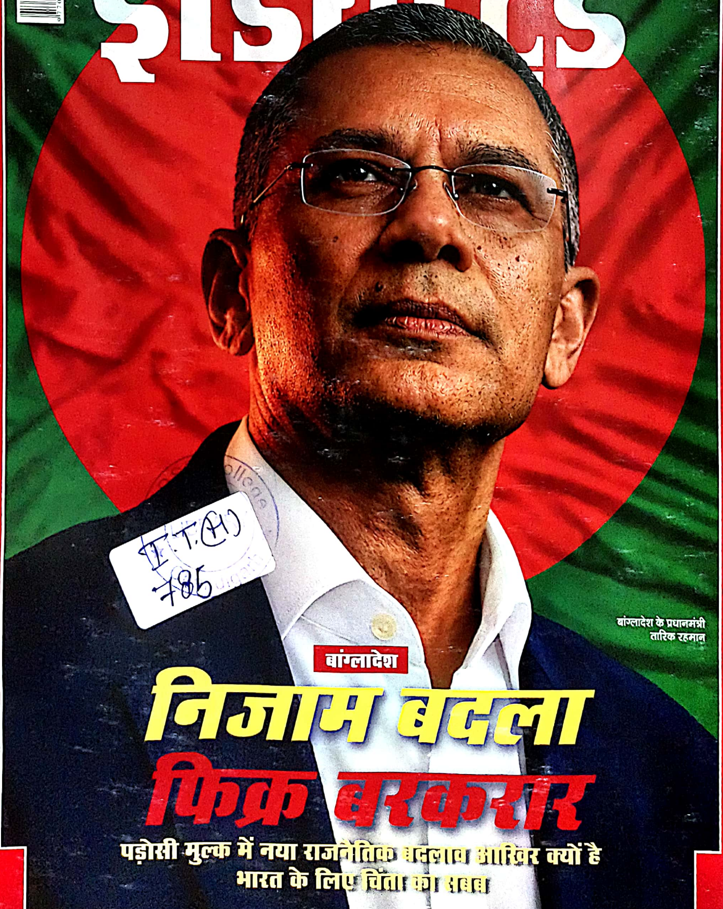
बांग्लादेश के प्रधानमंत्री शारिक रहमान

अग्रिम सत्राह के लिए प्रत्येक शनिवार को प्रकाशित। एनपीआर डिस्ट्री-आयएमएनएन-डिस्ट्री-110006 से प्रत्येक शनिवार और सोमवार को प्रेषित। कुल पन्ना की संख्या 80 (अवकाश संकेत) वर्ष 40। अंक 13