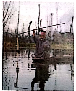
18 कश्मीर: डल झील पर बेफिक्री