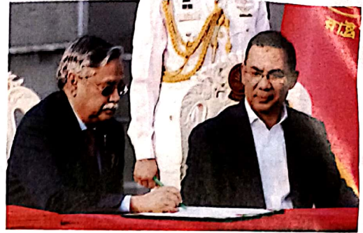
10 बांग्लादेश: कई नावों में पांव