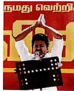
12 तमिलनाडु: विजय की चुनाव बाजी