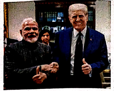
10 भारत-अमेरिका: करार के कदम