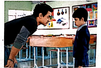
44 बाल फिल्में: खो गई दुनिया