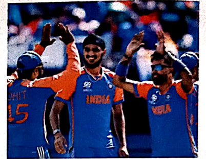
42 क्रिकेट: सियासी खेल