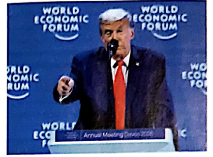
14 ट्रम्प दादगीरी: कदम पर दुविधा