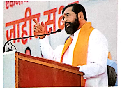
18 महाराष्ट्र: बदली नगरीय सत्ता