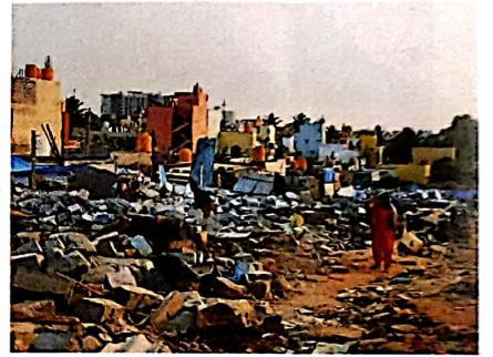
16 कर्नाटक: बुलडोजर सियासत