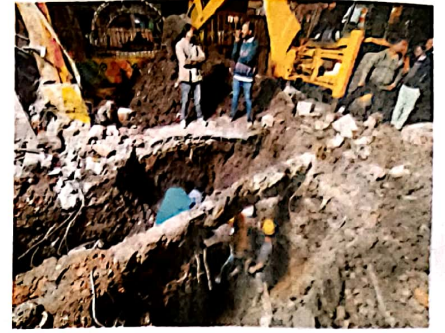
08 इंदौर: पेयजल मौतें