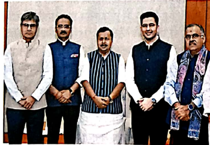
12 दलबदल: विलय कितना जायज