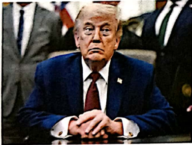
08 पश्चिम एशिया जंग: करार पर अड़चन