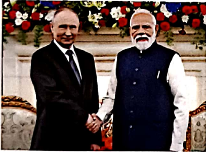
08 भारत-रूस: पुतिन कूटनीति