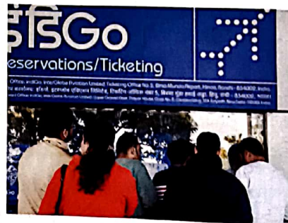
20 इंडिगो संकट: क्यों हुआ धड़ाम