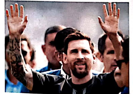
40 फुटबॉल नायक: मेसी फिनामिना