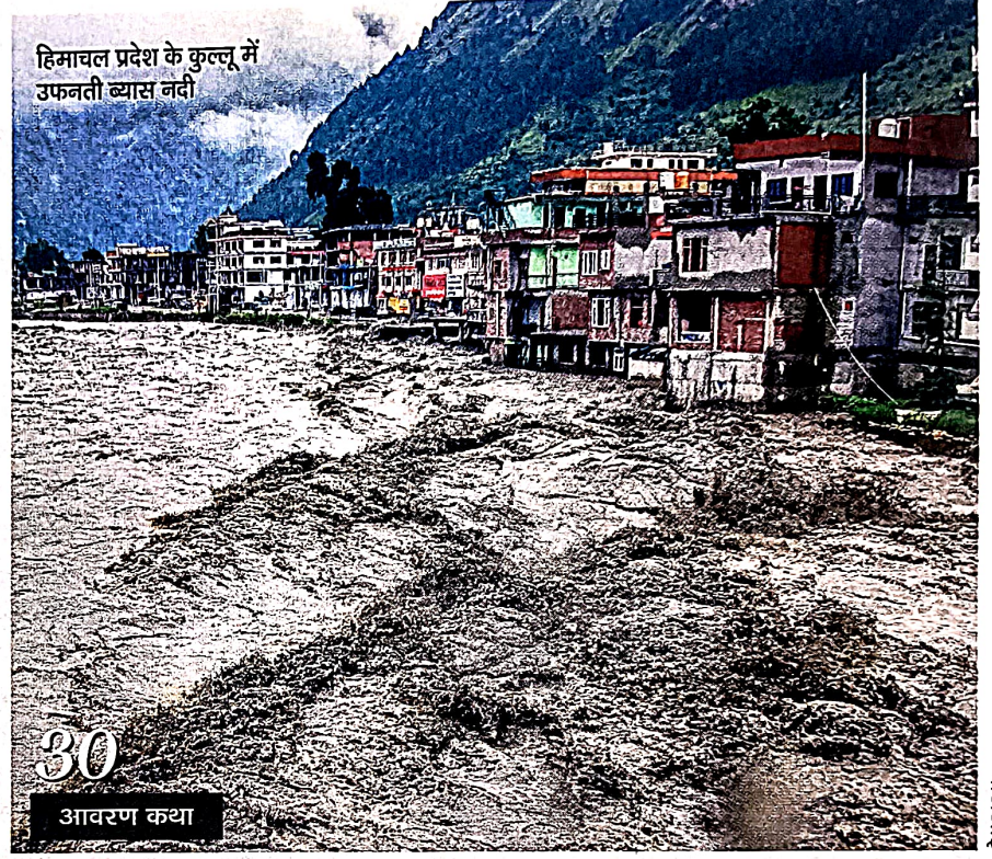
30 आवरण कथा

राज्य दर्पण: द्रमुक विरोधी मोर्चे में एकता का संकट पेज 20