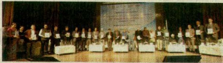
समारोह में उपस्थित वैज्ञानिक, शिक्षाविद तथा (दाएं) शोधपर प्रकाशनों व कार्यवृत्तों का विमोचन करते हुए।