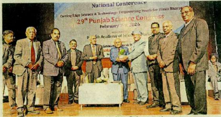
एसडी कालेज में आयोजित साइंस कांग्रेस के दौरान विशेषज्ञ कालेज

पंजाब साइंस कांग्रेस के साथ कालेज परिसर में इनोवेशन एवं एंटरप्रेन्योरशिप फेस्ट का भी उद्घाटन किया गया, जिसमें स्टार्ट-अप संस्कृति, वैज्ञानिक अनुसंधान और युवा नेतृत्व वाले उद्यमों पर विशेष ध्यान दिया गया। आयोजन को इंडिया नेशनल साइंस एकेडमी के चंडीगढ़ चैप्टर का सहयोग प्राप्त है। कार्यक्रम