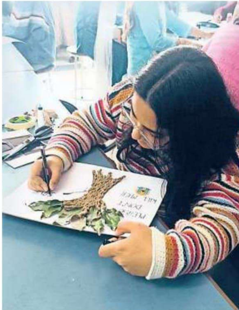
पोस्टर मेकिंग प्रतियोगिता में पोस्टर बनाती एक छात्रा • कालेज

उन्होंने 'द एरिसटोटल क्लब', फैकल्टी और वॉलंटियर्स की सक्रिय भूमिका की भी प्रशंसा की।