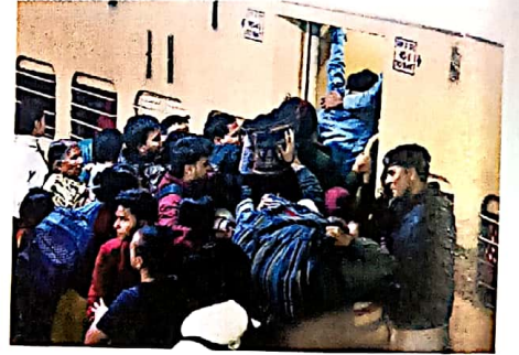
14 रेलवे: बढ़ईतजामी और कुप्रबंधन