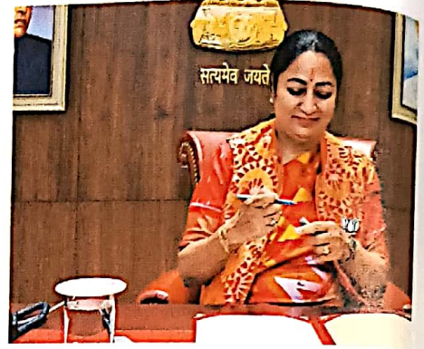
7 दिल्ली: नया चेहरा, नई सत्ता