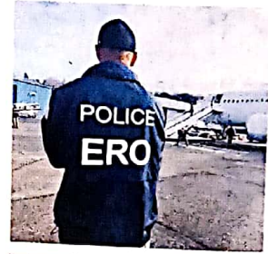
27 निर्वासन: आप्रवासियों का दर्द