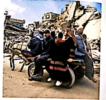
28 इजरायल-हमास: युद्ध-विराम