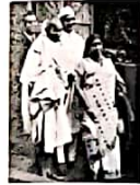
14 हरिजन: अनेखे अखबार की कहानी