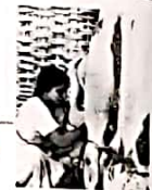
17 आनंद बन: अमृत वर्ष