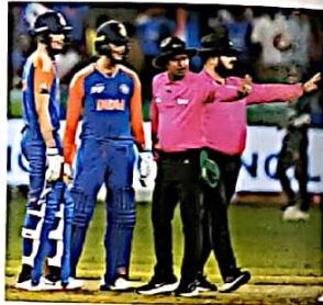
40 क्रिकेट: हाथ न मिलाते का राज