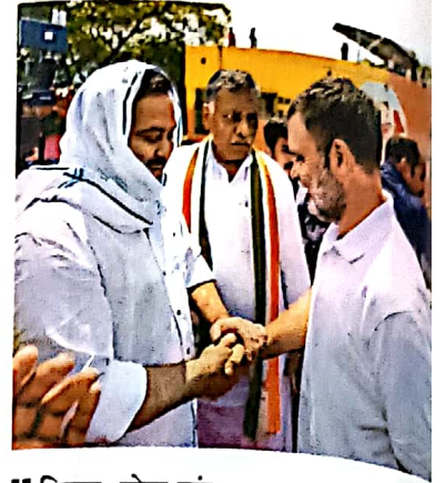
11 बिहार: वोटर जांच