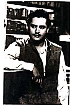
42 गुरु दत्त: प्यासे फिल्मकार की सदी