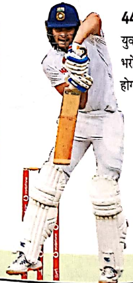
44 क्रिकेट: युवा गिल पर भरोसा कितना होगा कारगर