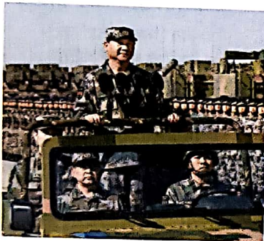
14 पूर्वी मोर्चा: नए त्रिकोण की फांस