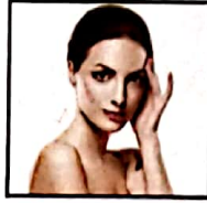
७४ स्किन केयर: कैसा हो आपका मॉर्निंग रूटीन