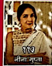
११३ नीना गुप्ता