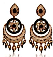
१२ तुम्हारा नूर