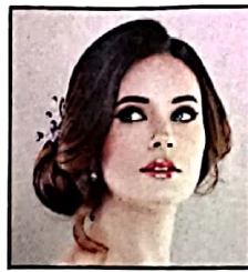
४४ फेस मेकअप