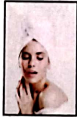
६७ खूबसूरती की दुश्मन हैं ये १० बुरी आदतें