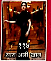
११४ सारा अली खान

कॉपीराइट: मेरी सहेली के कॉपीराइट पूरी तरह से सुरक्षित हैं और इसके सभी अधिकार आरक्षित हैं. इसमें प्रकाशित किसी भी विवरण को कॉपीराइट धारक/कंपनी से लिखित अनुमति प्राप्त किए बिना आंशिक या संपूर्ण रूप से पुनः प्रकाशित करना, सुधारकर संग्रहित करना या किसी भी रूप या अर्थ में अनुवादित करके इलेक्ट्रॉनिक, यांत्रिक, प्रतिलिपि, रिकॉर्डिंग करना या दुनिया के किसी भी हिस्से में प्रकाशित करना निषेध है. दुनियाभर में मेरी सहेली के सर्व अधिकार पायोनियर बुक कं. प्रा. लि. द्वारा सुरक्षित हैं. किसी भी प्रकार से पुनः प्रकाशन निषेध है. मेरी सहेली रजिस्टर्ड ट्रेडमार्क है और पूर्ण रूप से पायोनियर बुक कं. प्रा. लि. की प्रॉपर्टी है. पायोनियर बुक कं. प्रा. लि. के लिखित अनुमति के बिना इस ट्रेडमार्क का इस्तेमाल वर्जित है.