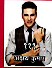
१११ अक्षय कुमार