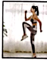
७० आज हम फिटनेस फ्रीक हैं, तो क्यों नहीं बीमारियों पर ब्रेक है?