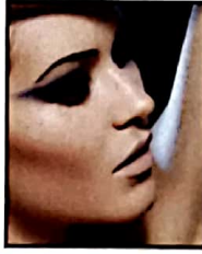
५० आईशेडो मैजिक