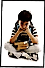
७२ स्ट्रेस फ्री रहकर कैसे करें एग्जाम की तैयारी?