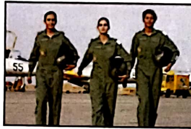
६४ देश के आकाश की रक्षा करती हैं ये जांबाज बेटियां, इनके जज्बे को सलाम!