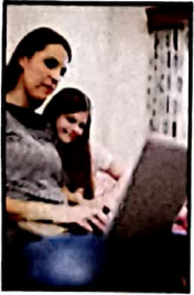
१०२ ये ६ डिजिटल पैरेंटिंग टाइप आपको बनाएंगे स्मार्ट पैरेंट्स