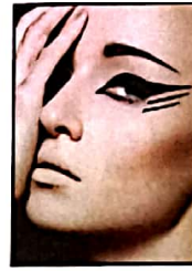
४७ आई मेकअप