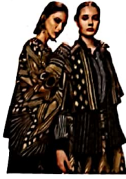
१३ खूबसूरत कहानी