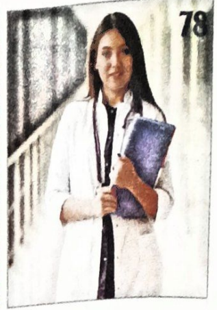
78 जमाना है हाफ डाक्टरों का