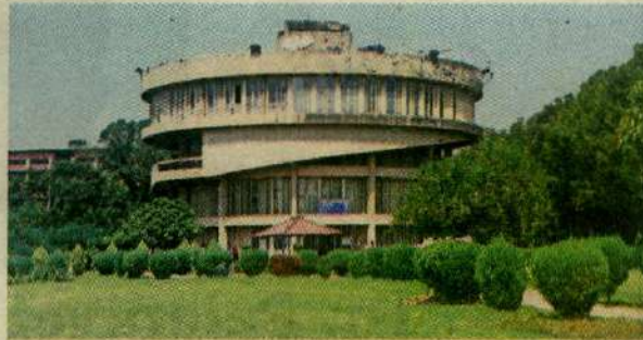
PU has also improved to 35th slot among universities.