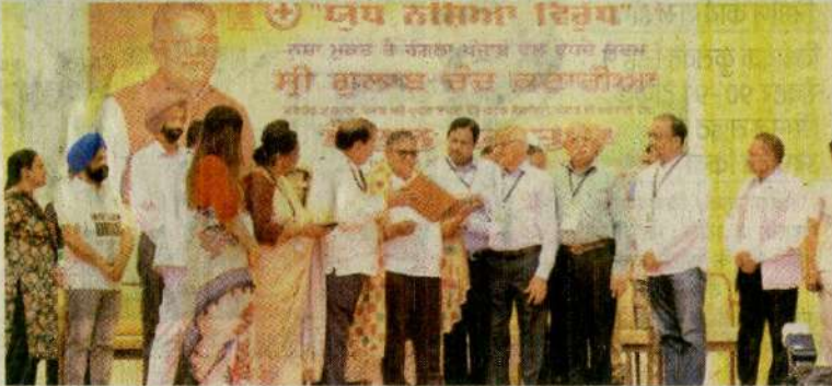
नशामुक्त पदयात्रा के दौरान राज्यपाल कटारिया का सम्मान करते हुए पदाधिकारी।

जीजीडीएसडी कॉलेज राज्यपाल के नेतृत्व में आयोजित नशा मुक्त भारत अभियान पदयात्रा में हुआ शामिल