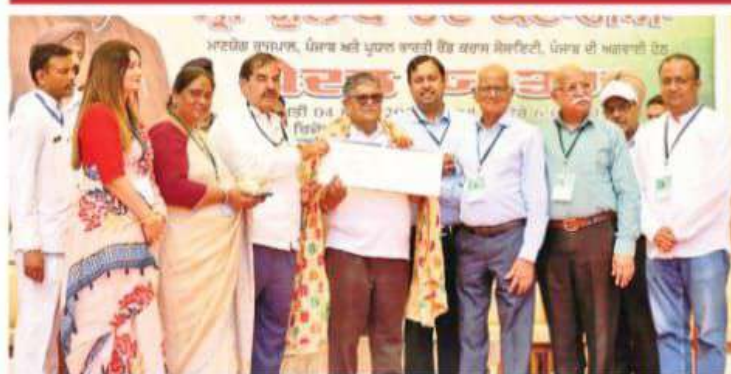
Governor Gulab Chand Kataria at Pt. Mohan Lal SD College for Girls during the statewide drive against drug abuse

Institution reaffirms commitment to social reform in powerful movement for a drug-free Punjab